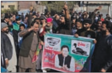
جمعیت گسترده‌ای از حامیان عمران خان در پاکستان، پس از اعلام نتایج انتخابات پارلمانی.

گفته شده نامزدهای مستقل وابسته به حزب تحریک انصاف پاکستان (PTI) به رهبری عمران خان، با کسب ۱۰۲ کرسی از ۲۶۵ کرسی، انتظارات را زیر پا گذاشتند.براساس گزارش جنو، مستقل‌ها ۱۰۲ کرسی به دست آوردند و پس از آن حزب مسلم لیگ پاکستان نواز شریف (PML-N) با ۷۳