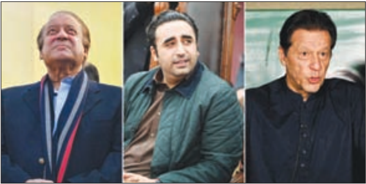
عمران خان، نواز شریف، نخست‌وزیر سابق پاکستان، در جریان انتخابات پارلمانی پاکستان.

محمدعلی بصیری استاد روابط بین‌الملل دانشگاه اصفهان در گفتگو با آفتاب یزد نتیجه انتخابات در پاکستان و پیامدهای آن را تشریح کرد