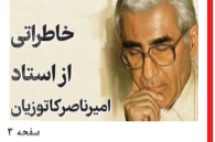
خاطراتی از استاد امیررضا کاتوریان