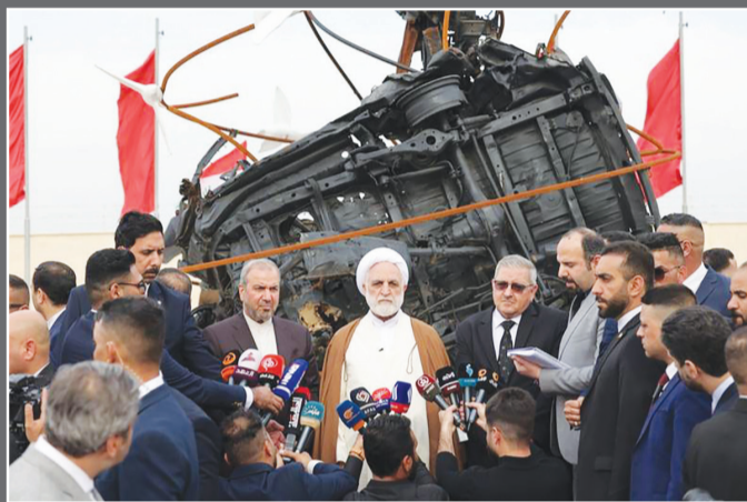
حضور رئیس قوه قضائیه در یادمان محل شهادت شهیدان حاج قاسم سلیمانی و ابومهدی المهندس

این یادمان، نشانه‌ای از جنایت‌های آمریکا و مستکبران امروز عالم است