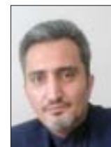
وحید استادی حقوقدان

بوده و بر همین اساس زوج می تواند در صورت عدم پرداخت، اقامه دعوی نموده و این دعوی قابل استماع است. ثانیاً، کاهش مهریه و یا بذل آن نیز با توافق زوج بلامانع است. ثالثاً، در صورت توافق زوجین بر تبدیل مهریه عندالمطالبه به عندالاستطاعه و برعکس و احراز این امر توسط دادگاه، حسب مورد احکام و آثار مهریه مورد توافق بعدی بر آن مترتب می شود. توضیحا اینکه فقهای محترم شورای نگهبان در نظریه ای اعلام داشته اند مهریه شرعی همان است که در زمان عقد تعیین شده است و ازدیاد مهریه بعد از عقد شرعاً صحیح نیست و آثار مهریه بر آن مترتب نخواهد بود.