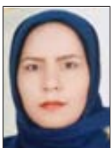
مهديه رعيتي حقوقدان

اگر والدین بعد از به دنیا آمدن نوزاد را در بیمارستان رها کرده و محل را ترک کنند مرتکب چه جرمی شدند و مجازات آن چیست؟