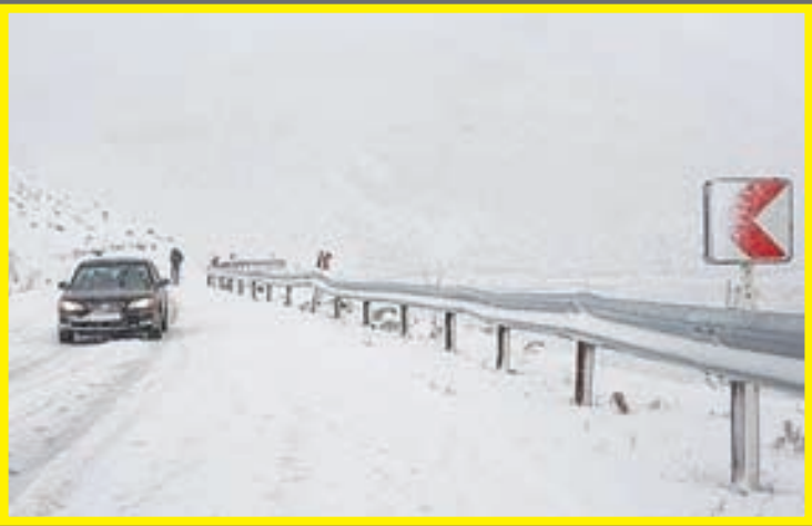
فراتر از نرمال، بارش فراتر از نرمال

سازمان هواشناسی احتمال داده که در نیمه بهمن ماه، شاهد وقوع بارش فراتر از نرمال خواهیم بود