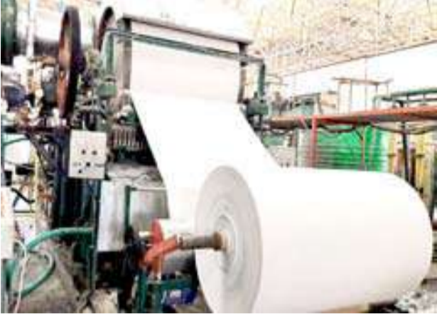
دستگاه کاغذسازی در یک کارخانه تولید کاغذ در استان آذربایجان غربی

مُشت نمونه‌ی خروار هست یانه را تردید دارم اما بین ۱۴ هزار تومان ۱۳۸۷ و ۸۰۰ هزار تومان ۱۴۰۲، فاصله‌ای معادل ۵۷۰۰ درصد یا عامیانه تر؛ ۵۷برابر!