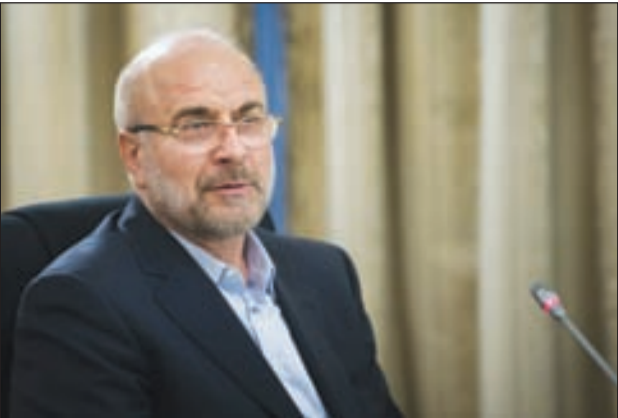
محمدباقر قالیباف در جریان سخنرانی در مجلس شورای اسلامی

«مثلاً قالیباف در اولین همایش جبههٔ انقلاب برای انتخابات مجلس گفته:«نباید در سهم‌خواهی رقابت کرد» حالا ببایم با آقای رئیس پارلمان جدل فلسفی به راه بیندازیم که؛ سهم خواهی در ذات هر رقابتی است و اساساً اگر سبم خواهی نبود خود آقای قالیباف نماینده و سپس رئیس مجلس نمی‌شد یا بگذریم و به روی خودمان هم نیاوریم؟!»