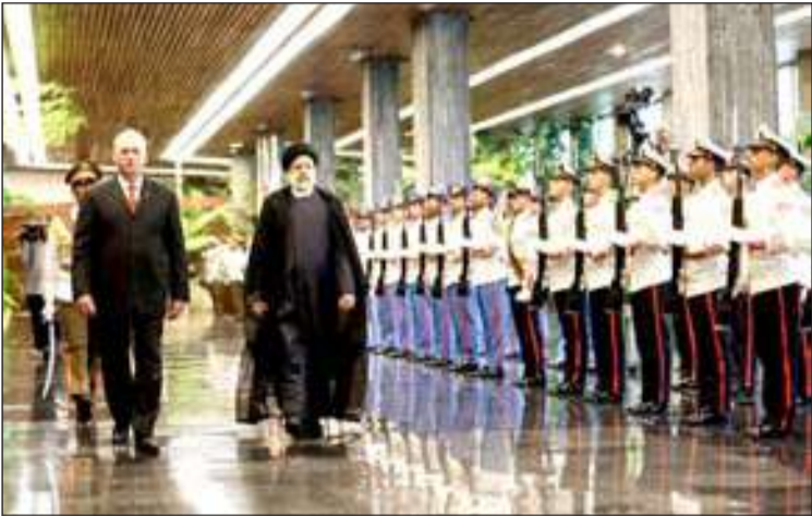
استقبال رسمی رئیس جمهور کوبا از رئیسی /هاوانا(خرداد ۱۴۰۲)

عاملی گفت: ما چند ماه پیش از مدیران خواستیم نامه‌های وزرا را منتشر کنیم اما نکردند اگر منتشر می‌شد سیل نفرین به طرف وزیر و نماینده‌ای که برای اشخاص خاص کار می‌کند روانه می‌گردید حالا که منتشر نکردند ما آنها را از بالای نفرین خلاص نمی‌کنیم و بر فرض وقوع چنین خیانتی به هر دو طایفه نفرین می‌فرستیم البته احتیاج به نفرین ما نیست آن نیروی شرکتی که ۲۰ سال است در یک اداره کار می‌کند اما تبدیل وضعیت نشده و یک لحظه می‌بیند کسی به صورت صفر کیلومتر استخدام شده او با تمام وجود خودبه بانئ این خیانت نفرین می‌فرستد و در نتیجه خزانه و نامه اعمال خائنن پر از نفرین است اضعاء حق الناس و ایجاد بدبینی به نظام اسلامی همیشه