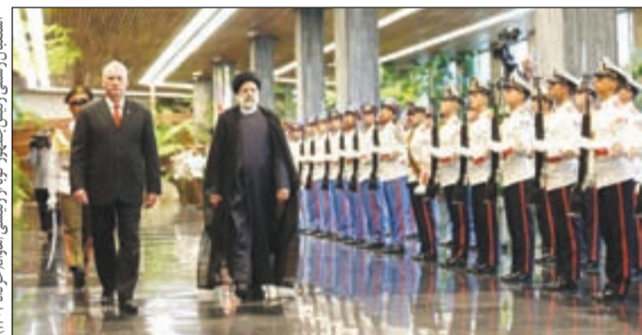
استقبال رسمی رئیس‌جمهور کوبا از رئیس‌جمهور ایران در ۱۴۰۲