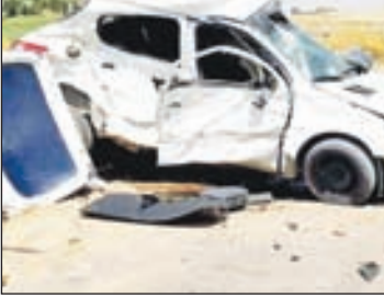
تصادف در جاده‌های ایران در سال ۱۳۹۸، ۱۰ درصد افزایش یافته است.

راهداری و حمل‌ونقل جاده‌ای در مجمع جهانی هوشمند بنامه‌ریزی کرده و در مسیر تطبیق اقدامات خود با نیازمندی‌های هوشمندسازی فناوری‌های حمل و نقل جاده‌ای را دارد.