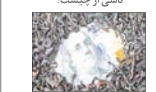
آفتاب یزد بررسی می کند

خرده روایت ها، کلان روایت ها و تناقض و تضادها در گزارش دهی پیرامون یک فساد ۳،۳۷ میلیارد دلاری ناشی از چیست؟