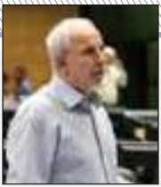
تصویری از یکی از مقامات دولتی.

تصریح کرد: ما در کمیسیون تلفیق حتما این درصد پیشنهادی برای افزایش حقوق را اصلاح خواهیم کرد. عضو کمیسیون تلفیق بودجه ادامه داد: فکر می‌کنم حداقل افزایش باید ۲۰ درصد باشد نه سقف آن ضمن اینکه با توجه به بودج‌بندی دولت، مساله مستهمل و باید هم‌ترازی برای بازنتیج‌بندی انجام شود، در سال اول هم‌ترازی را بالاتر ببریم تا این ۲۰ را در آنجا پوشش دهیم. وی گفت: خب دولت با عدم اجرای دقیق قانون مجلس در خصوص ارز ترجیحی