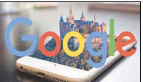
بناهای تاریخی پشتیبانی شده را به صورت سه بعدی مشاهده کنید، باید به Google.com یا برنامه جستجوی Google در

Android یا iOS بروید. با این قابلیت کاربران می‌توانند در همه زوایا، بناهای مورد نظرشان را مشاهده کنند. همچنین این قابلیت به شما اجازه می‌دهد تصویر سه بعدی بنا را از طریق دوربین تلفن همراهتان وارد محیطی که در آن قرار دارید بکنید. بناهایی که برای مشاهده سه بعدی در جستجوی گوگل در دسترس خواهند بود عبارتند از: بیگ بن، برج ایفل، پارتنون، اسکای تری توکیو، موزه لور، طاق پیروزی، کلیسای سانتا ماریا نوولا، پل بروکلین، قلعه امید خوب، بنای یادبود کلمب، ساختمان امپایر استیت، پل گلدن گیت، برج کج پیزا، چشم لندن، یادبود ملی کوه راشمور، کاخ ملی، مرکز تجارت جهانی یک، کاخ ورسای، یادبود روز، استون هنج، موزه ملی توکیو، میدان ترافالگار، کلیسای وست مینستر، بیوگی استادوم هستند.