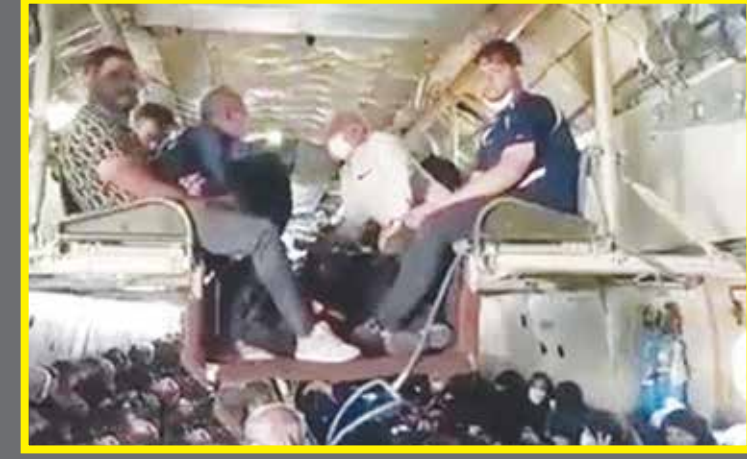
برخورد جدی دادستانی با گران فروشی بلیت هواپیما