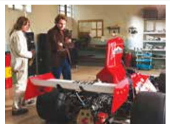
آدم از دشمنان بیشتر چیز یاد می‌گیرد تا از دوستان احمق. شتاب - ران هاوارد

روی رخسار توای موز به دل داریم ما - منت یاد بریچه‌ها موز داریم ما... علی‌اچیل یک نفر به ما مگوید بخاطر گرانی میوه خصوصا موز لعنت‌هایمان را مستقیم نثار «سلاطین میوه» کنیم یا کاخ سفید؟