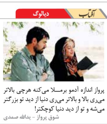
پرواز اندازه آدمو برملا می‌کنه هرچی بالاتر می‌ری با بالاتر می‌ری دنیا از دید تو بزرگتر می‌شه و تو از دید دنیا کوچکترا!

قبلا هم گفتم چسرا در آمریکا بسا آن همه اهن و تلوپ یک شورایی جهت بررسی صلاحیت کاندیداهای ندارد که یک آدمی که آقا زاده‌اش در اوکراین و روسیه فساد مالی دارد تایید نشود؟ آه که چقدر موضوع فساد مالی هانتر بایدن در انتخابات مطرح شد کسی توجه نکرد و ادعا کردند: این اتهامات بیبوهه است و پروژه تخریب رقیب را کلید زدند. حتی برخی ساده لوح شعار می‌دادند: "هر چی باشه بزار باشه فقط ترامپ دیگه نباشه!" لذا در انتخاب بین گزینه‌های بد و بدتر، بد را انتخاب کردند! بحث گزینه بد و بدتر شد ما هم بارها بین انتخاب گزینه بد و بدتر همین کار را کردیم مثلا در انتخاب گزینه بدتر یعنی تخم‌مرغ شلانه‌ای ۵۲ هزار تومان گزینه بد تخم‌مرغ شانهای ۳۸ هزار تومان را انتخاب می‌کنیم!