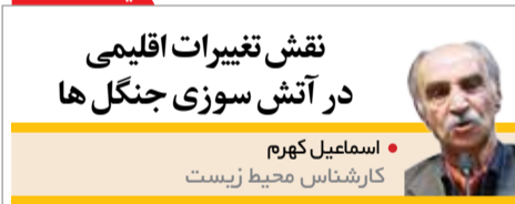
اسماعیل کهرم کارشناس محیط زیست