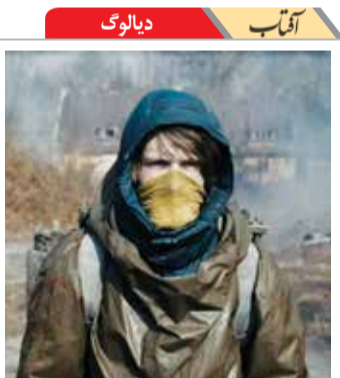
آفتاب دیالوگ تفکر ما با دوگانه گرایي شکل گرفته: ورود و خروج، سیاه و سفید، خوب و بد. هر چیزی به صورت دو جفت متضاد هم ظاهر می‌شه اما این اشتباهه. تاریک – باران با او دارد

با ارز فضایی تو دهن ارز زمینی (دلار) می‌زنیم!- که ارزش دلار افت کند خاک بر سر شود.فریاد «دلار آمریکایی – چقدر تو بی‌بهای» سحر دهیم. انوقت روای مدتها به گل مانده و خواب آلود ما شاید محقق شود یعنی پول ما هم دوباره جان بگیرد. چنان که با یک اسککناس تراول یک وانت بار خرید کنیم. این یعنی تحول، این یعنی رسناسی اقتصادی و تحول معیشتی. شاید مردم بتوانند با این تحول و رسناسی اقتصادی گذر از بینوائیسم به رفاهیسیم یا گذر از طبقه مفلس به طبقه منعم را تجربه کنند. آری زندگی را طوردیگر باید دید. روابط دیپلماتیک با فضایی‌ها یک سوپر دیپلماسیست. من شک ندارم مقامات فضایی به کشور بیایند حتما همه جناح‌ها از آنها استقبال می‌کنند قرارداد با آنها را ترک‌نمای نمی‌دانند. با فرازمینی‌ها شاید بتوان مشکلات زمینی‌ها را حل کرد. قیلا هم گفتم اگر بیایند بنده زیر پایشان فرش قرمز پهن می‌کنم البته به سبب یک رسم دیپلماتیک نه وادادگی به بیگانگان. هر چند اینها که گفتم تخیل و رویاست. ولی من عاشق رویام.