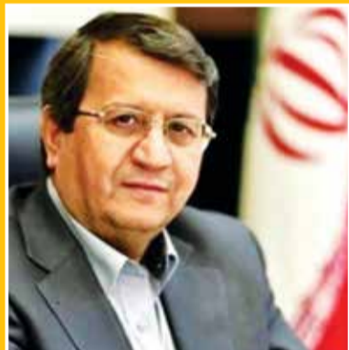
محمد باقر نوبخت رئیس سازمان برنامه و بودجه