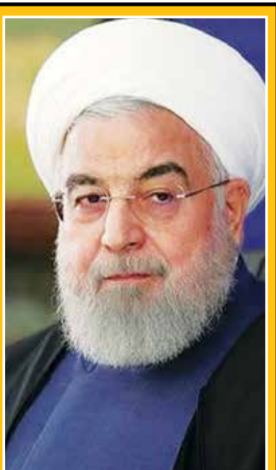
حسن روحانی رئیس جمهور

چالش میان وزارت بهداشت با بخش اقتصادی دولت ادامه دارد؛ در آخرین رویداد نمکی گفته اشتباهی وزیر شده و آن میزان پولی که از طرف دولت برای این وزارتخانه تخصیص داده شده را نمی خواهد زیرا کم است