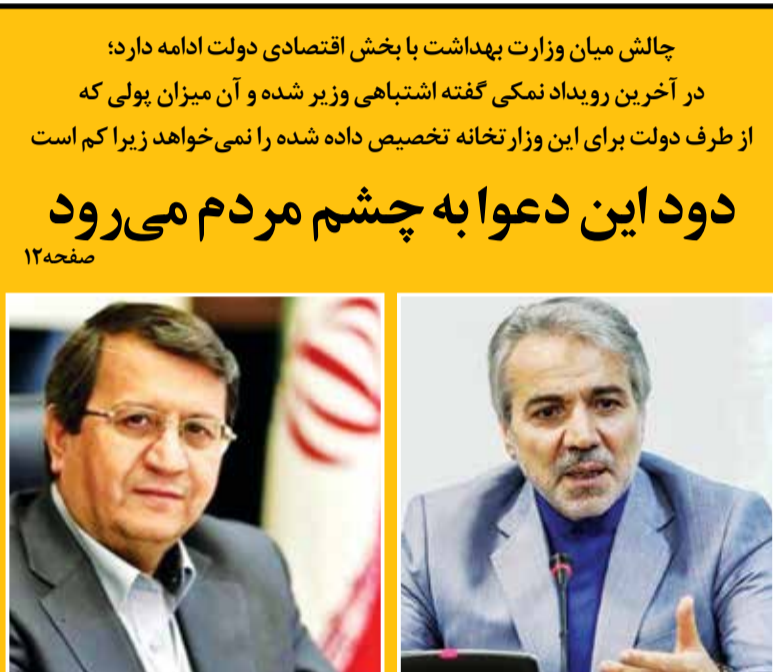
عبدالنصر همتی رئیس کل بانک مرکزی