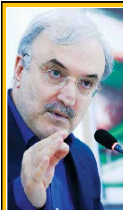
سعید نمکی وزیر بهداشت