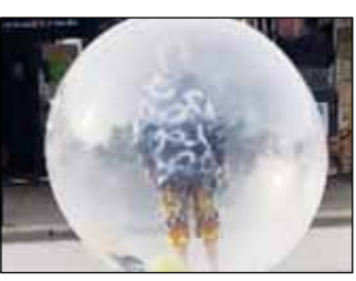
این مرد استرالیایی در خیابان خود از حباب بزرگ استفاده می‌کند تا مبتلا نشود به کرونا!