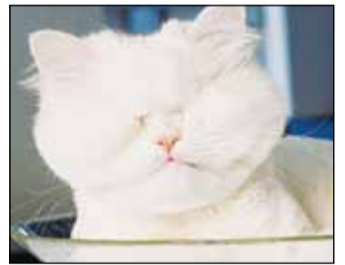
میدونی یه نفر بهم گفت رازها وزن دارن هر چقدر بیشتر پیش خودت نگه داری سخت‌تر می‌تونی ادامه بدی!