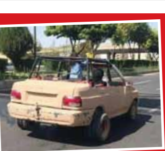
برای درورن آفرودبازها

چوپاکابرا زمانی که گزارش‌هایی مبنی بر قتل‌عام دام‌ها در آمریکای جنوبی افزایش یافت، مسئولین اعتقاد داشتند این قتل‌عام را سگ‌های ولگرد یا انسان‌هایی که بیماری روانی دارند، انجام داده‌اند! اما کمی بعد از آن، عامل این کشتار بزرگ شکارچی زشتی شبیه سگ معرفی شد. این واقعه در کشورهایی مثل پورتوریکو، جمهوری دومینیکن، شیلی، کلمبیا، آرژانتین، پرو، مکزیک و حتی بخش‌هایی از ایالات متحده آمریکا اتفاق افتاد. گفته می‌شود چوپاکابرا یا «بُر مکنده» پوستی سیاه دارد و برآمدگی‌های تیزی بر روی پوست آن قرار گرفته است. تقریبا یک متر ارتفاع دارد و بعد از ایجاد یک سوراخ در سر یا گردن طعمه خود، خون آن را می‌مکد. هنوز کسی نمی‌داند این موجود واقعا یک موجود ناشناخته است یا سگی بدتر کیب است که کمتر مشاهده می‌شود.