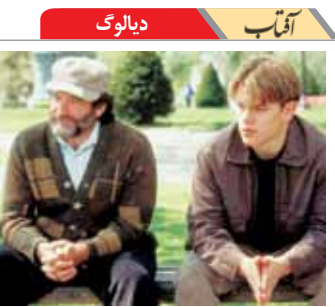
ایرادای هر آدمی هویت اون آدمو نشون میده. ویل هانتینگ خوب – گاس ون سنت

بنده به رئیس جمهور دوترته عرض می‌کنم: زمانی کشور شما "مهد خوشگذرانی" بود از این پیشنهادات خشن دست بردارید. نگذارید کشور مهد "خشم چرانی" شود!