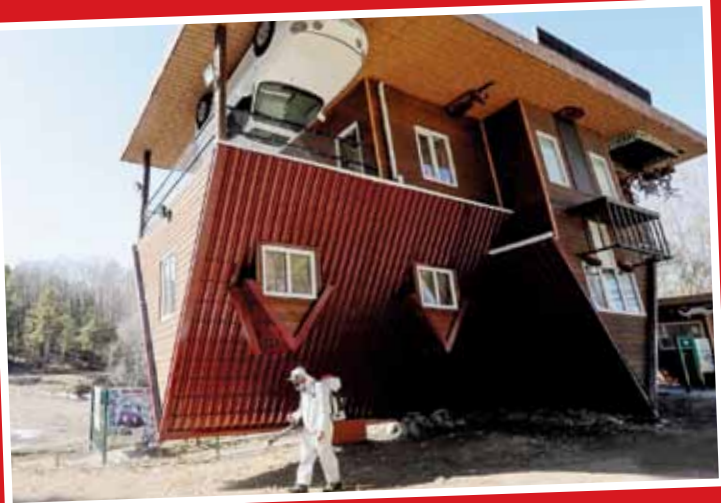
یک خانه وارونه ساخته شده در کراسنویارسک روسیه