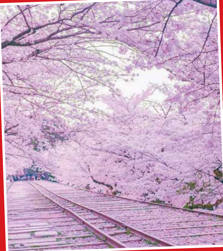
در شهر هاگاتای ژاپن یک پارک ملی بزرگ و پرطرفدار به نام «یومیتونا کامیچی» وجود دارد. این پارک که بین گردشگران داخلی و خارجی شهرت دارد، دارای زمین‌های بزرگ ورزشی، بازی و سرگرمی، باغ وحش و از همه مهم‌تر باغ‌های گل است.