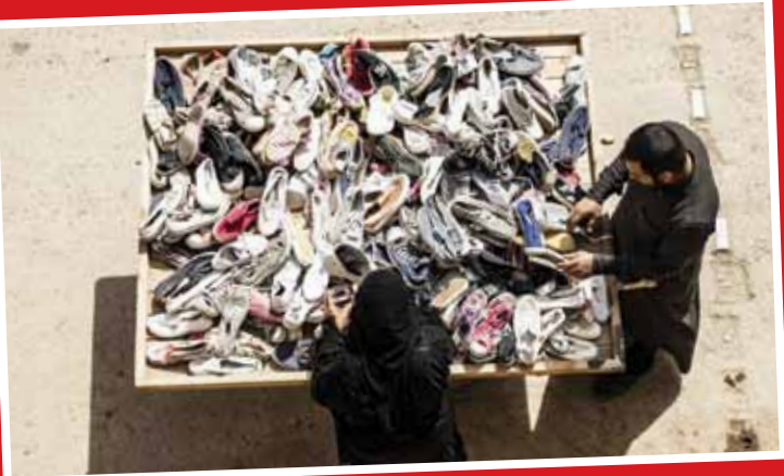
کفش فروشی سیار در شهر رقه سوریه