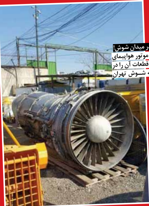
فروش موتور هواپیما در میدان شوش در این تصویر فروش موتور هواپیمای اسقاط شده و سایر قطعات آن را در ضایعاتی های منطقه شوش تهران می بینید.

زمانی محمدرضا شجریان به خاطر رعایت نکردن حقوق مؤلف از پخش بی اجازه آثارش از صداوسیما شکایت کرد و بررسی شکایت او تا ماه رمضان سال ۸۸ نیز ادامه داشت. در آن زمان شجریان «رینا» و «مناجات افشاری» خود را به ملت ایران تقدیم و تأکید کرد حساب این دو اثر از بقیه آثارش جداست. بعد از شکایت رسمی این هنرمند از صداوسیما، عده ای از مدیران رادیو و تلویزیون اعلام کردند دیگر حتی ربنای استاد را هم پخش نمی کنند، از جمله این افراد می توان به محمدحسین صوفی، معاون صدا اشاره کرد که در واکنشی تند اعلام کرده بود: «از این پس حتی در ماه رمضان صدای محمدرضا شجریان از شبکه های رادیویی پخش نمی شود.» او که پیش از این ریاست مرکز موسیقی صداوسیما را به عهده داشت، در گفت و گو با ایسنا گفته بود: «برای تولید برخی از آثار استاد شجریان سازمان صداوسیما هزینه کرده است، با این حال از این پس هیچ یک از این آثار از رادیو پخش نمی شود.» چند روز بعد از اظهار عقیده صوفی، زراعتگر، مدیر نظارت و