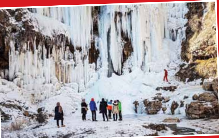
انبار یخزده خور / فارس