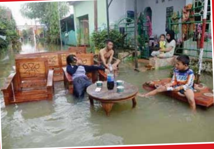
مردم نشسته در سیل -اندونزی