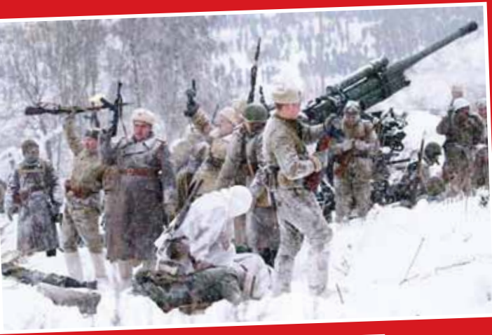
بازسازی صحنه نبرد تاریخی ارتش روسیه در هفتادوپنجمین سالگرد رفع محاصره منطقه «لنینگراد» در زمان جنگ جهانی دوم

قوانین است و قطعاً به این حکم اعتراض می کنیم زیرا معتقدیم حکم، با نادیده گرفتن محتویات پرنده و مستندات من به عنوان وکیل شاکی صادر شده است. بدون تردید اگر در مرحله تجدید نظر دقت کافی شود، این رأی باید نقض شود و گرنه پیام بدی برای صداوسیما دارد مبنی بر این که از این به بعد می تواند آثار هنرمندان را که برای تولیدشان وقت و هزینه صرف می کنند، بدون موافقت صاحب اثر پخش کند.» شهرام ناظری، استاد آواز ایرانی، در واکنش به این موضوع گفت: «... الان ۴۰ سال است که آثار مرا پخش می کند و هیچ حق و حقوقی به من نداده است. هیچ قرارداد نداده است و هیچ اجازه ای هم نگرفته است. اگر بخواهند نگاهی صحیح، قانونمند و عادلانه داشته باشند، باعث تعجب است. به خارج از این مملکت نگاه کنید و به هنرمندان شان که هر قطعه ای در هر جایی از آنها پخش شود، خود به خود و به صورت طبیعی مبلغی را که به عنوان حق الزحمه برایشان در نظر گرفته اند به حسابشان می یزند و زمانی که هنرمند از دنیا می رود، این حق الزحمه به فرزند او و حتی به نسل های بعدی اش پرداخت می شود و اساساً داستانشان با ما متفاوت است، چرا؟ چون همه چیزشان روی قانون است.»