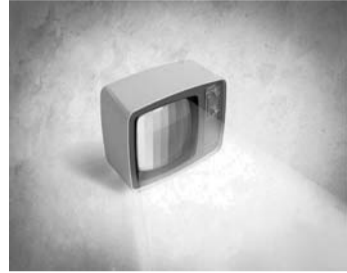
آگهی در دی ماه در عدد ۱،۴ ضرب می‌شود.