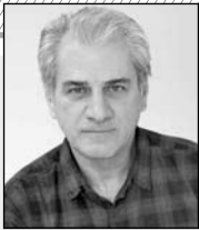
فرانسوی‌ها با بازیگر سینما و تلویزیون با اشاره به فرانسوی‌ها سی و هفتمین جشنواره فیلم فجر در مورد چگونگی انتخاب آثار در این رویداد سینمایی گفت: از نظر من انتخاب نهایی آثار سینمایی ایران از سوی مردم اتفاق افتاده و آنچه در بعضی جشنواره‌های همچون فجر رخ می‌دهد انتخاب آخر نیست. انتخاب از سوی داوران و منتقدین محترم است اما مردم می‌توانند سرنوشت یک اثر را مشخص کنند. وی درباره دلیل گزیده کاری خود برای بازی