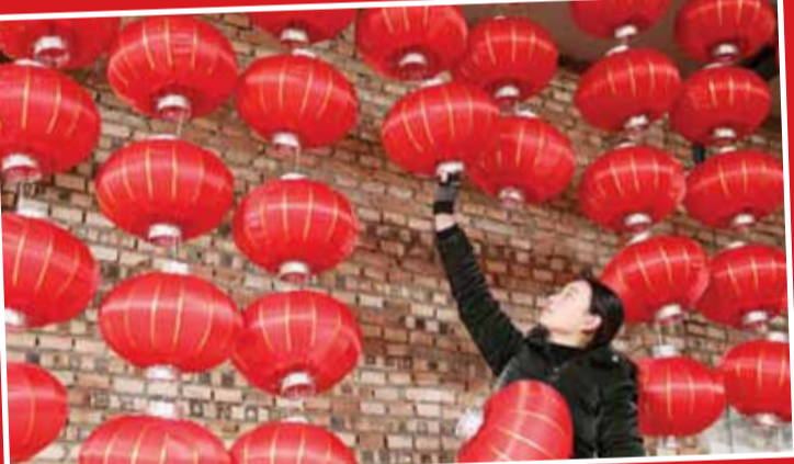
آمادگی برای سال نو چینی در روستایی در شمال چین