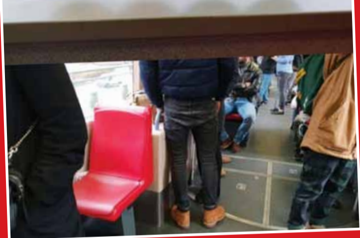
متسرو وین و خالی ماندن صندلی ویژه افراد توان یاب یا دارای شرایط ویژه (سالمنندان، روشندان، افراد حامل نوزاد و زنان باردار)