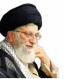
رهبر معظم انقلاب اسلامی:

آن روزها حدود یک ماه از شروع محاکمه شادروان مصدق در دادگاه نظامی می‌گذشت و جریان دادگاه نشان می‌داد که در مدت زمان کوتاهی رای فرمایشی علیه رهبر نهضت ملی که بدون شک حکم محکومیت خواهد بود، صادر خواهد شد. به همین جهت از مدتی قبل نظامیان که به نظر می‌رسید از مأموران فرمانداری نظامی باشند در محوطه دانشگاه حضور و رفت و آمد دانشجویان را زیر نظر داشتند.