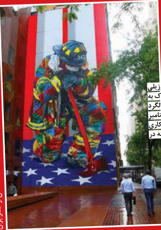
نقاشی دیواری هنرمند برزیلی در محله منهتن نیویورک به مناسبت هفدهمین سالگرد حادثه تروریستی ۱۱ سپتامبر و در تجلیل از فداکاری آتش‌نشان‌های جان باخته در این حادثه