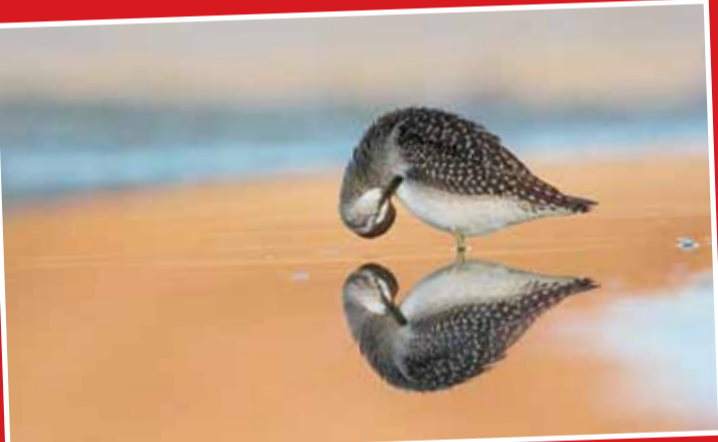
عکسی بی نظیر از پرند در ساحل

عکاس روبر تو مار کنتلی تصویری بی نظیر از بازتاب عکس یک پرند در ساحل را شکار کرده است که بیشترین آن را در انتخاب عکس برتر به خود اختصاص داده است. این پرندگان کوچک معمولاً در آب‌های کم عمق کنار ساحل حرکت می‌کنند تا غذای مورد نیاز خود را بیابند. در این تصویر اینگونه دیده می‌شود که گویا پرند بر روی آینه‌ای شفاف ایستاده است.