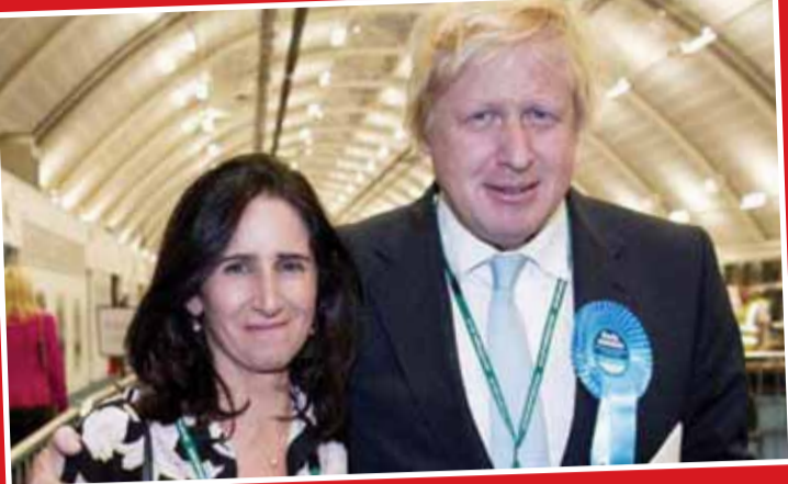
بوریس جانسون از همسرش جدا می‌شود جانسون و مارینا ویلر که ۲۵ سال با هم زندگی کردند در بیانیه‌ای مشترک گفتند که مراحل طلاق در جریان است. جانسون وزیر خارجه سابق بریتانیا است