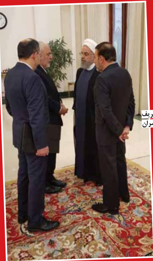
گفت و گوی روحانی و ظریف پیش از آغاز نشست سران ایران، روسیه و ترکیه