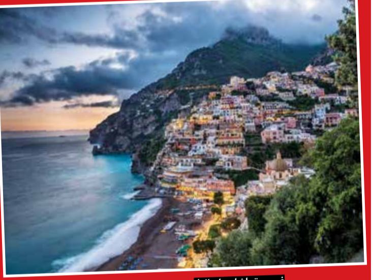
غروب تماشایی ایتالیا عکس روز نشنال جئوگرافیک غروب خورشید در پوزیتانوی ایتالیا را نشان می‌دهد. پیتر فریدمن، عکاس این عکس سه بار از این صحنه عکاسی کرد و پس از ترکیب آنها توانست به تصویری برسد که خودش در آن منطقه مشاهده کرده بود.