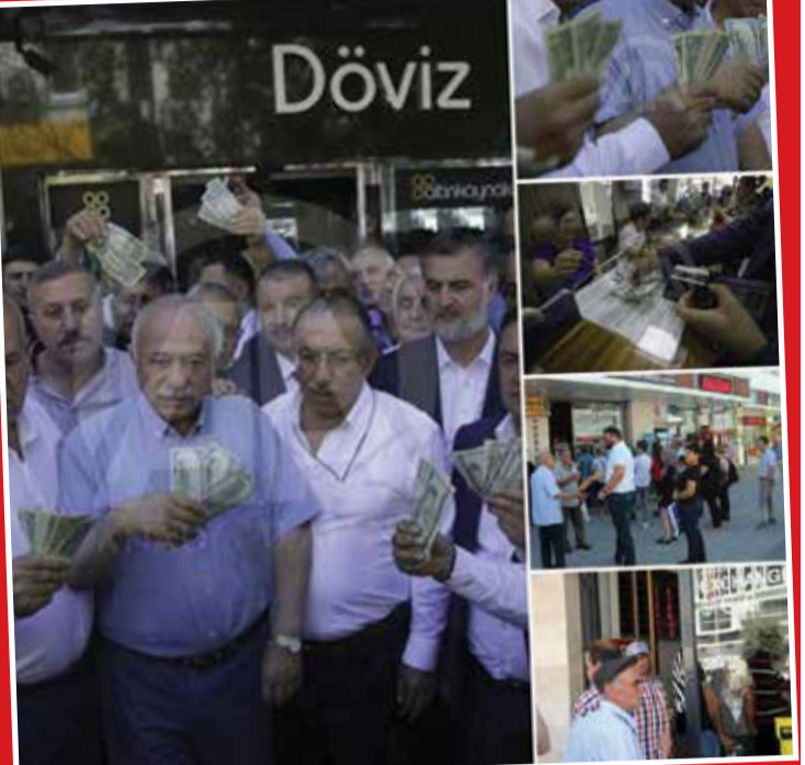
در پی افت شدید ارزش لیر ترکیه در برابر دلار آمریکا مردم ترکیه مقابل صرافی‌ها صف کشیدند تا دلارهای خود را روانه بازار کنند