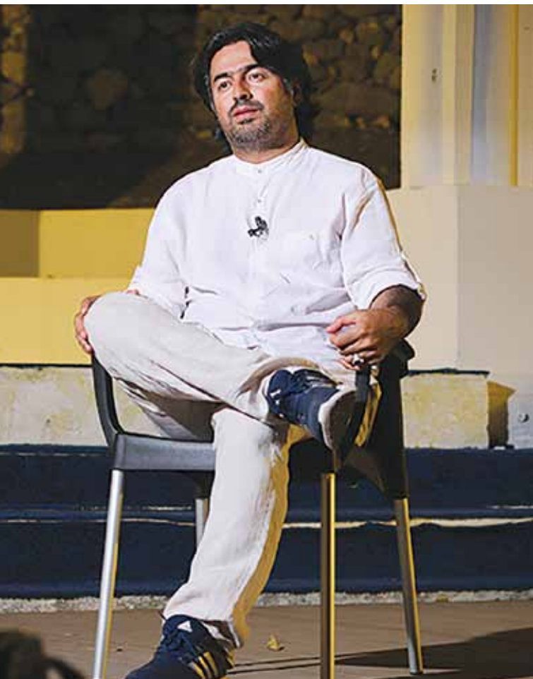
در حال تمرین هستیم.

پرواز همای (خواننده آواز ایرانی و سرپرست گروه موسیقی مستان) پس از اجرای اپرای «موسی و شبان» به رهبری ارکستر شهرداد روحانی در خارج از کشور و «عشق و عقل و آدمی» در کاخ سعدآباد، سومین تجربه‌اش را در این زمینه در ایوان عطار این کاخ، روی صحنه برده است. در خلاصه داستان اپرای «حلاج» آمده است: اواخر قرن دوم، ادیب و سراینده‌های بزرگ به نام حسین بن منصور حلاج مبارزهای ملی، ایدئولوژیک و عارفانه را علیه خرافه‌ها، تندروی‌ها، فساد و نابرابری‌ها آغاز کرد که با خشم صوفیان و خلفای آن زمان بغداد مواجه و دستگیر شد. او هشت سال از زندانی به زندان دیگر انتقال دادند و در پایان به اتهام دروغین ربوبیت محاکمه‌اش کردند؛ نخست دست‌هایش را بریدند و سپس پاهایش را و بعد زبانش را و در آخر او را به دار آویختند و پیکرش را سوزاندند و خاکسترش را بر باد دادند... پرواز همای در این اپرا علاوه بر آن که نقش حلاج را بازی می‌کند، آهنگسازی، کارگردانی و تهیه‌کنندگی‌اش را هم برعهده دارد. او برای نگارش متن از اشعار مولانا، عطار و حافظ استفاده کرده است و در کنار آن از اشعاری سروده خودش.