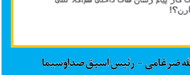
سید عزت الله ضرغامی - رئیس اسبق صداوسیما

موگرینی تصریح کرد: اجرای توافق در هر دو زمینه تعهدات هسته‌ای و اقتصادی باید ادامه یابد چرا که بخش ضروری دیگر این توافق رفع تحریم‌ها و فرصت‌هایی است که این توافق برای عادی‌سازی روابط اقتصادی و تجارت با ایران فراهم می‌کند. از این منظر تصمیم آمریکا برای خروج از برجام و وضع مجدد