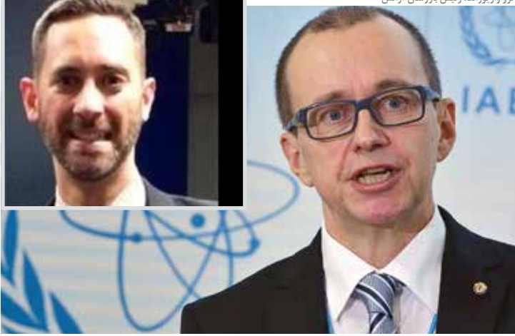
ترو وارپورانتا، رئیس بزرسان آژانس

در این توافق را ارائه می‌داده، کسی که هنوز توضیحی در باره استغفایش نداده است و همین معادلات را پیچیده تر می‌کند. وارپورانتا تا به حال با گزارش‌هایش باعث شده تا همیشه یوکیو آمانو فعالیت‌های هسته ایران و پایبندی کشورهای به توافقی هسته‌ای را تأیید کند اما اکنون با این استغفای غیر منتظره این سوال مطرح می‌شود که آیا واقعا می‌توان از این پس هم به گزارش‌های آژانس درباره ایران امیدوار بود؟ و آیا ممکن است استغفای وارپورانتا تحت تاثیر نوعی ناامیدی از ادامه برجام و یا به دلیل اعمال فشار باشد؟ آیا این استغفا می‌تواند ادامه فعالیت‌ها و سرنوشت برجام را نیز تحت تاثیر قرار دهد؟