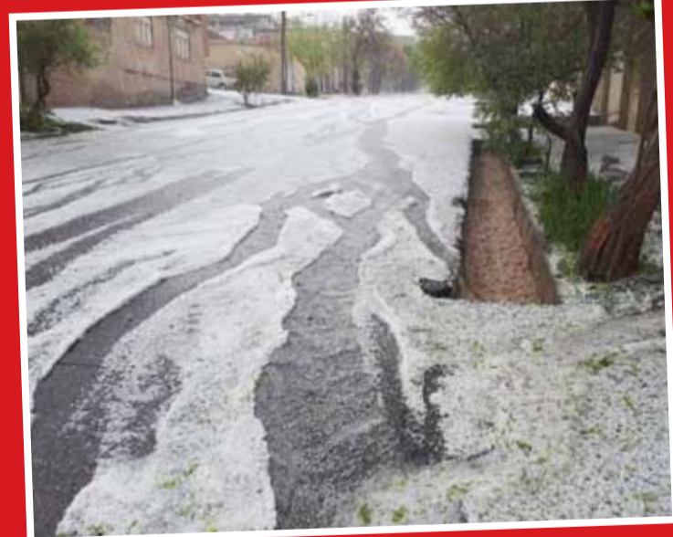
بارش شدید تگرگ در مراغه

متمه اورا یکی از بزرگ‌ترین و مهم‌ترین مجموعه‌های کلیسای ارتدکس یونان است. این ۶ صومعه روی ستون‌هایی سنگی در شمال غربی لبه دشت تسالیدری نزدیک رودخانه پاپینس و کوه‌های پینداس در یونان مرکزی ساخته شده‌اند. نزدیک ترین شهر به متورا شهر کالامیاکاست. متورا در سال ۱۹۸۸ در لیست میراث جهانی یونسکو ثبت شده و در زبان یونانی به معنی «معلق در هوا» است.