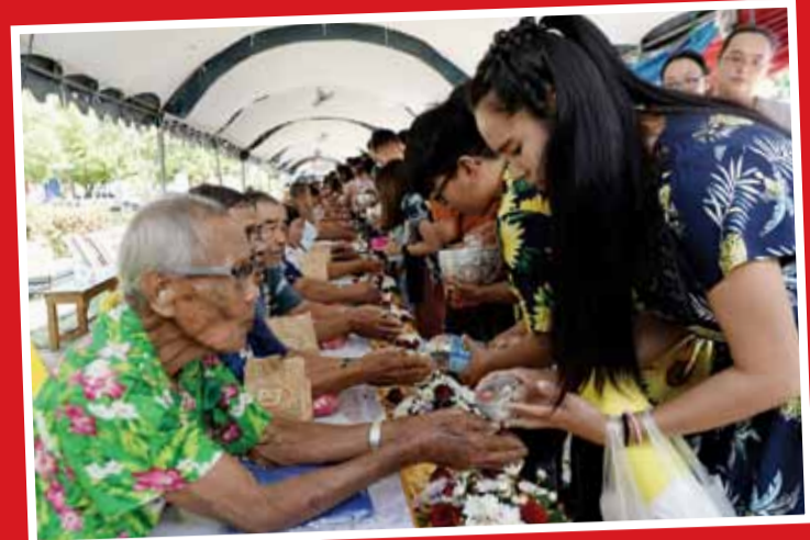
شستشوی دست‌های سالمندان از سوی جوانان به عنوان یکی از رسوم سال نو تایلندی - ناراتیوات تایلند