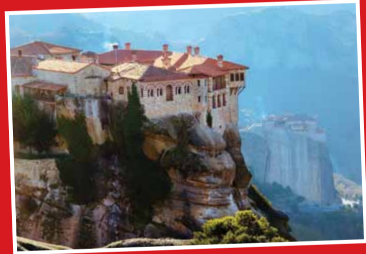
مجموعه کلیسای معلق در هوا در یونان

متمه اورا یکی از بزرگ‌ترین و مهم‌ترین مجموعه‌های کلیسای ارتدکس یونان است. این ۶ صومعه روی ستون‌هایی سنگی در شمال غربی لبه دشت تسالیدری نزدیک رودخانه پاپینس و کوه‌های پینداس در یونان مرکزی ساخته شده‌اند. نزدیک ترین شهر به متورا شهر کالامیاکاست. متورا در سال ۱۹۸۸ در لیست میراث جهانی یونسکو ثبت شده و در زبان یونانی به معنی «معلق در هوا» است.