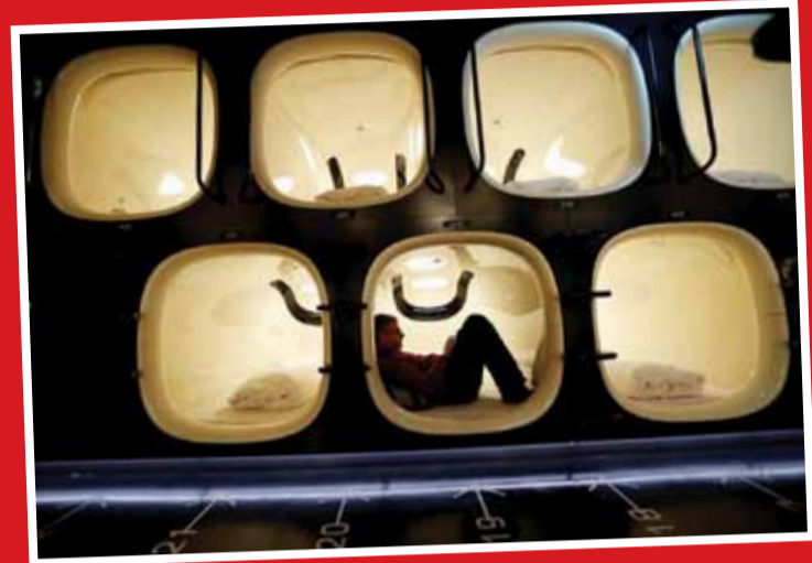
هتل کپسولی در شهر توکیو ژاپن