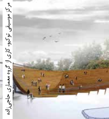
۹. کوره موسیقی در کور کار از گروه معماری حاجی‌زاده