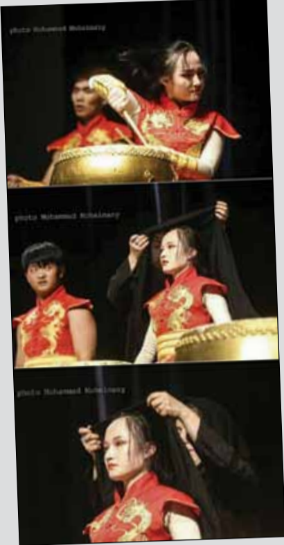
افتادن روسری عضو گروه چینی در جشنواره فجر؛ به‌سرعت روسری بزرگ‌دانه شد.

چین تکون به خودش نمیده، چرا؟» شخصی نیز عنوان داشته است: «حادثه کشتی نفتکش سانچی حادثه کمی نیست، ولی اصلاً بهش توجه نمیشه، چون کسی نمی‌تونه باهانش سلفی بگیره!» دیگری نوشت: «حقیقتاً برای اون عزیزانی که سرنوشتشون نامعلومه نگران و ناراحتیم... برای خانواده‌هاشون بیشتر.» کاربران دیگر نوشته‌اند: «دریانوردان در آتش نفتکش می‌سوزند و خانواده‌هاشون در آتش سکوت خور می‌کنند...»، «انتظار واسه رسیدن خبر کشته شدن یا زنده‌بودن عزیزت سخته، وقتی مطمئنی خبر بدی میاد، ولی به هر چیزی جنگ میزنی که باور کنی شاید معجزه‌ای اتفاق افتاده و نجات پیدا کرده. آرزوی صبوری و طاق‌ت برای خانواده‌هاشون دارم»، «الهی بمیرم واسه همسر این دریانورد... به‌خدا در حقیقت کوناهای کردن...»، «چرا جان انسان‌ها اینقدر بی‌ارزش شده؟ چرا سیاست تو زندگی‌مون سبقت گرفته؟ چرا پلاسکو به ماه طول کشید جمع بشه؟ چرا بعد از ۷ روز نفتکش خاموش نشده؟»، «دردناکه این انتظار. امیدوارم به‌زودی خبرهای خوب برسه و خانواده‌ها از ته‌دل خوشحال بشن»، «نفتکش سانچی با بی‌خبری چند روز از ۳۰ خدمه‌اش خود پلاسکووی دیگه است»، «از صبح کنار خانواده دریانوردان نفتکش ایرانی بودم و بی‌اغراق قلبم مجاله شده؛ وقتی دختر سرمولان با گریه داد می‌زد: این ۳۰ نفر سال‌ها برای یک ملت کار کردن؛ الان وقتشه که این ملت دینشون رو ادا کنن نمی‌دونستم چی باید بگم»، «انتظار