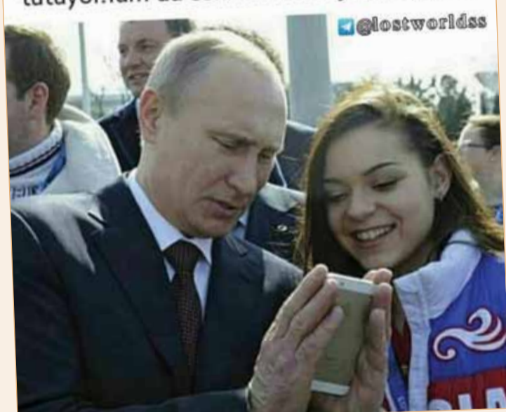
به افسر ارشد اینچوری گوشی رو میگیره دستش که اثر انگشت روش نمونه!