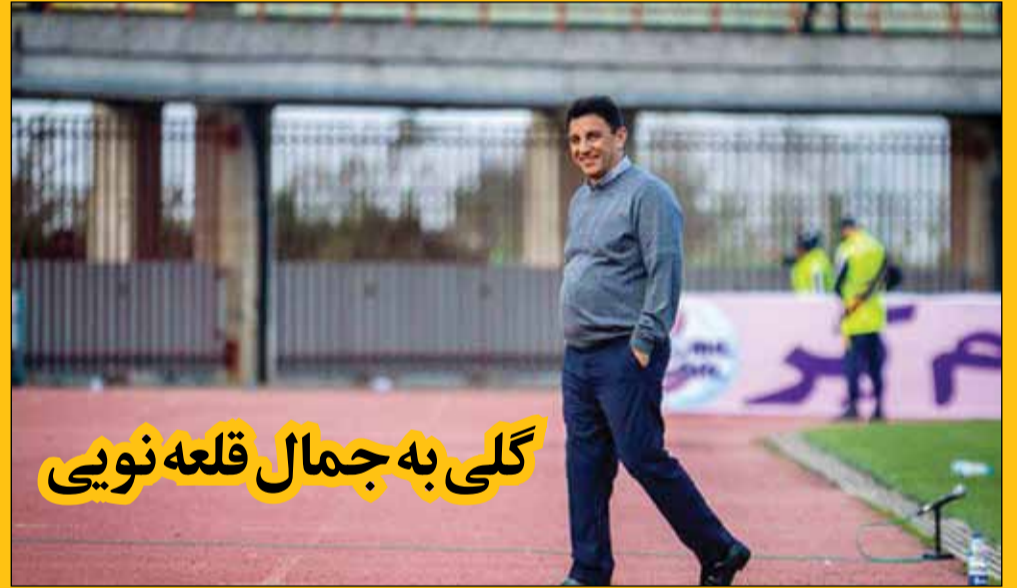
گلی به جمال قلعه نویی

به دنبال این اظهارات، کاربران زیادی از اینکه قلعه نویی به مهم ترین خواسته زنان توجه داشته است از وی تشکر کردند. همچنین کاربرانی نوشته اند: «باز گلی به جمال امیر قلعه نویی بقیه که هیچی نمیکن»، «من به پرسپولیس هستم، ولی امیر قلعه نویی رو دوس دارم»، «بازم مگه زنال آبی بیساد از مطالبات خانما توی انتخابات دفاع کنه و پیگیر باشه. خانما که خودشون ظاهر امر آموزش کردن چیا میخواستن.»