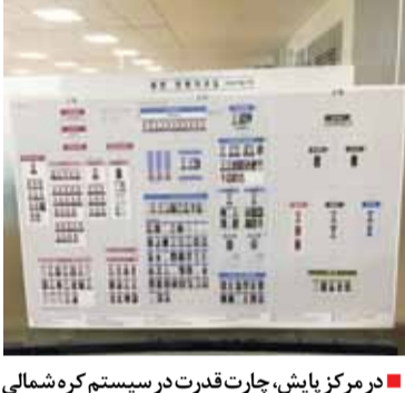
■ در مرکز پایش، چارت قدرت در سیستم کره شمالی به همراه عکس‌های سران شمالی نصب شده‌است.