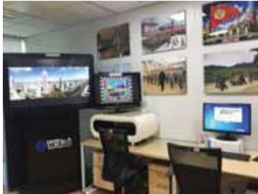
■ مرکز رصد کره شمالی در ستول - دیوارها عکس‌هایی از کره شمالی پوشیده شده‌اند.