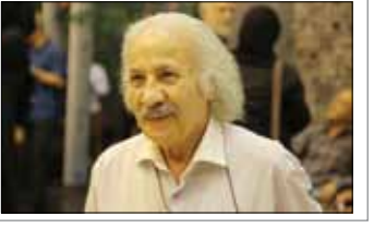
کوتاه از هنر

سعيد پير دوست، بازیگر تئاتر، سینما و تلویزیون درباره فعالیت‌های خود در عرصه هنر گفت: در حال بازی در سریال «۸۷ متر» کیناوش عیاری هستم که بخشی از آن فیلمبرداری شده و بخش دیگری از آن مانده که باید به‌تدریج تولید شود. وی دلیل کم‌کاری خود و بسیاری از هنرمندان پیشکسوت را تهیه‌کنندگان و کارگردانان دانست و اظهار کرد: ما همیشه تابع گروه تولید و فیلمسازان هستیم. هرگاه دعوت کنند در آثار حضور پیدا می‌کنیم و اگر دعوت نکنند زندگی خود را می‌کنیم. با بالا رفتن سن و سال ما نمی‌توانیم به‌سرعت تهیه‌کنندگان و کارگردانان برویم و از آنان بخواهیم که ما را در آثار خود به بازی بگیرند، بلکه آنها باید به‌دنبال ما بیایند. پیردوست درباره دلایل عدم ادامه همکاری با مهران مدیری در سال‌های اخیر، تصریح کرد: در این باره اصلاً نمی‌خواهم صحبت کنم، اما هر کسی سلاطین و عقیده‌هایی دارد که مربوط به خودش است. نمی‌توانم به او بگویم چرا در این کار هستم و در کار دیگری نیستم. اینکه گفته می‌شود اختلافی بین من و مدیری وجود دارد اصلاً صحت ندارد. من از دوستداران مدیری هستم، به او مدیون و به‌دکاک هستم و امیدوارم بتوانم دین خود را از آن بکنم.