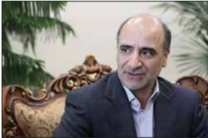
رسیدگی شده است.

پرسید، اظهار داشتیم که در هفت مورد قطعی رئیس‌جمهوری دولت‌های نهم و دهم محکوم شده است و این اعلام مبنی بر آن نبود که در مردادماه این موضوع اعلام شده است بلکه زمانی که این موضوع رسانه‌ای شد پرونده به مجلس اعلام شده و اجرای آن آغاز شده بود. وی با بیان اینکه در برخی پرونده‌های تخلفات نفتی موضوع مجرمانه‌بودن مطرح بوده که اعلام شده است، ادامه داد: دیوان محاسبات صفر تا صد رسیدگی به تخلفات مالی و ضرر و زیان وارده به بیت‌المال را در درون خود انجام می‌دهد حتی اجرای آرا و احکام در درون دیوان محاسبات مورد بررسی قرار می‌گیرد. به‌گزارش ایرنا، دادستان دیوان محاسبات تصریح کرد: آرای صادره در دیوان محاسبات در هیچ مرجع دیگری قابل اعتراض و تجدیدنظر نیست.