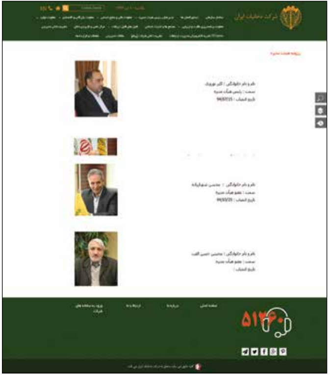
عضویت افت در چند شغل از جمله هیئت مدیره شرکت ذخایات ایران