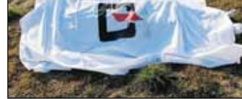
بررسی بیشتر به پزشکی قانونی منتقل شد و تحقیقات درباره این پرونده ادامه دارد.

جنوب) کشف شده است. دقایقی بعد از اعلام خبر، سجاد منافی آذر به همراه اکیپ تشخیص هویت آگاهی و کارشناسان پزشکی قانونی در محل کشف جسد حاضر شده و مشغول تحقیقات درباره این پرونده شدند. شواهد نشان می‌داد که جسد متعلق به مردی حدوداً سی و پنج ساله است، وی ظاهراً کارتن خواب