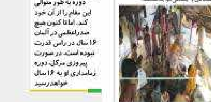
آنگلا مرکل، صدراعظم آلمان، در جریان یک دیدار عمومی.