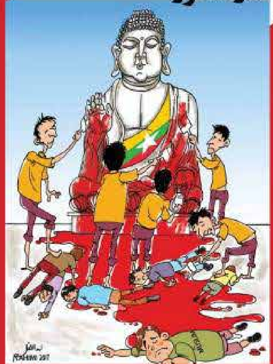
میانمار: شششوی در خون ایوانگلیس رحیمی