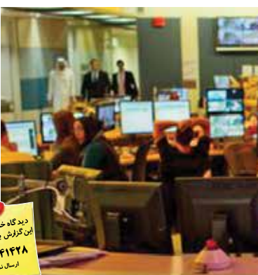
دیدگاه خود را در مورد این موضوع با ما در میان بگذارید. این گزارش به پیام کوتاه ۳۰۰۰۱۴۲۸ ارسال کنید

فرستی به آن داده شود. آتش‌بس مورد توافق روسیه و آمریکا در سه منطقه درعا، قنيطرة و سویدا به اجرا درآمده و شامل ایجاد نواحی بدون درگیری در مرز بین اردن و اسرائیل خواهد بود. به گفته بنیامین نتانیاهو اگرچه در این طرح ۲۰ کیلومتر فاصله بین نیروهای ایران تا مرز اسرائیل در نظر گرفته شده، اما به دلیل اینکه این آتش‌بس می‌تواند به تثبیت حضور نظامی ایران در آن منطقه کمک کند، اسرائیل با آن مخالف است.