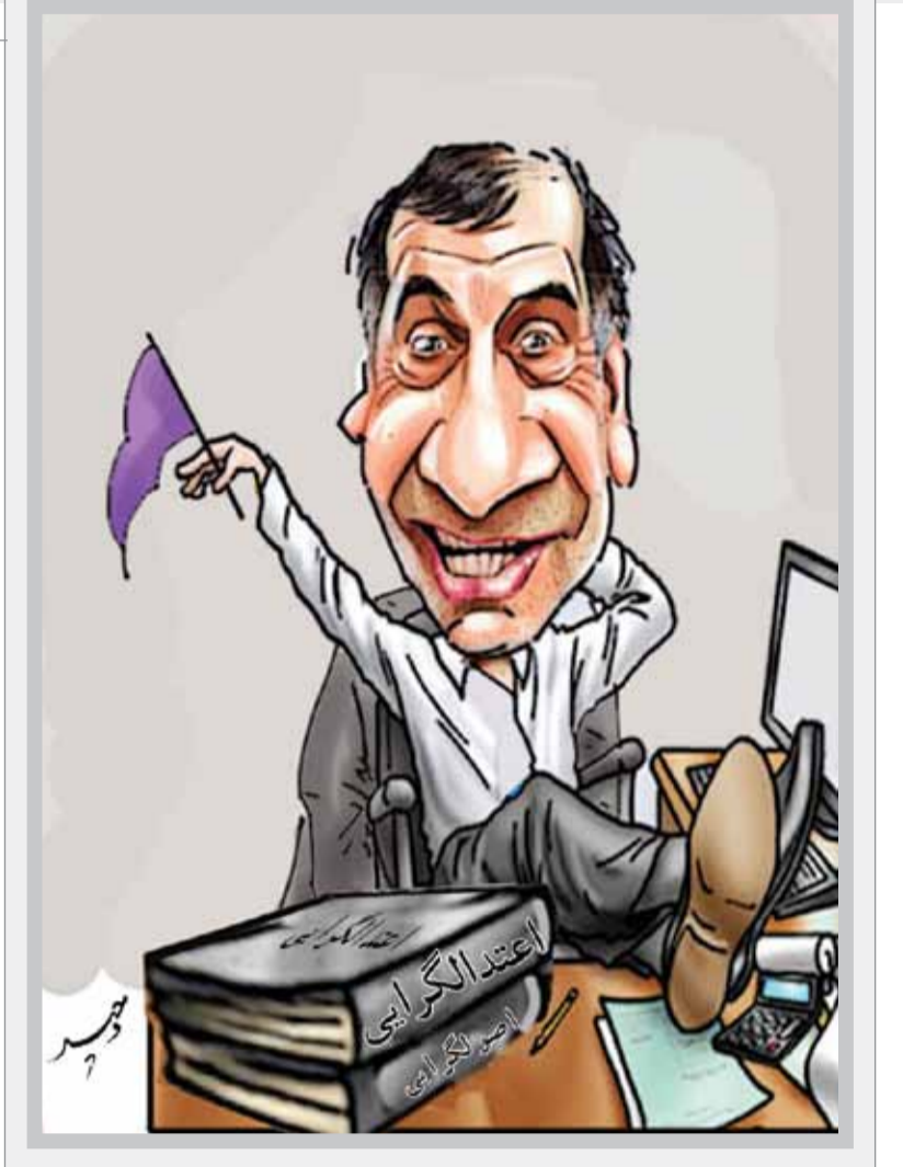
آفتاب • اناتومی اپیدمی‌های ناهنجار