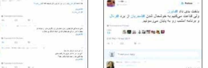
باید با پدرش رثال دارد و روزی یک بار با او ملاقات می‌کند.

فوتبال تماشا می‌کنند، می‌خواستیم بگویم امشب اگر هرکی بازی باین‌مونخ و رثال مادرید را می‌بیند، دعا کند که رثال ببورد چرا که پدر واقعا از برد این تیم خوشحال می‌شود. نکته جالب اینجاست که در بازی سه شنبه شب تیم مورد علاقه استاد شجریان یعنی رثال مادرید مقابل باین‌مونخ به پیروزی رسید. این اتفاق باعث شده که بسیاری از کاربران در فضای مجازی از خوشحالی شجریان اظهار کرده اند. حتی کسانی که طرفدار تیم باین‌مونخ بودند از باخت تیم شان ناراحت نشوند چرا که معتقد بودند که این باخت به خوشحالی استاد آواز ایران می‌آرزد. بسیاری هم به طنز برد این تیم را به شجریان ربط می‌دادند.