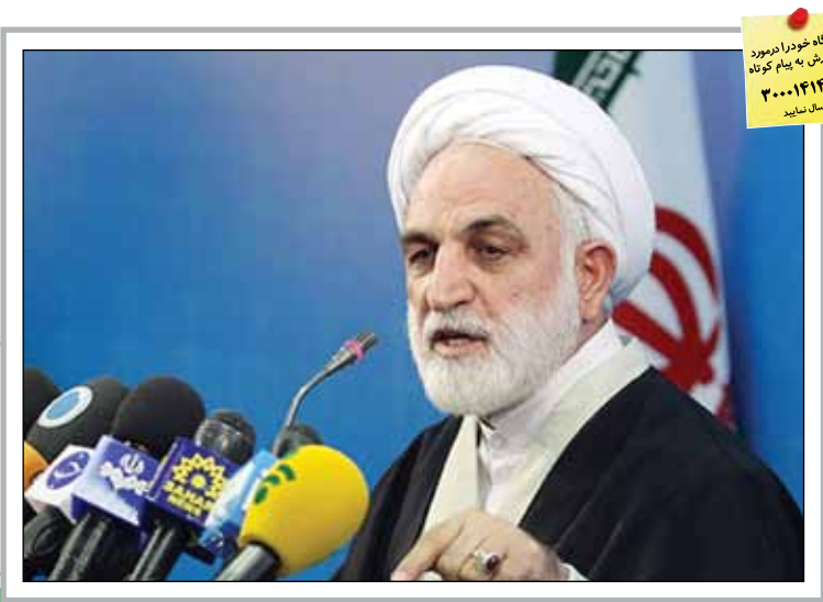
رئیس کمیسیون امنیت ملی با اشاره به احتمال انتشار اسناد محرمانه ایران در بروجرد از سوی ترامپ اظهار داشت: ایران از انتشار هر گونه سند محرمانه استقبال می کند، چرا که بر حقانیت و متعهد بودن ما تاکید مضاعف خواهد شد. نماینده مردم بروجرد در مجلس دهم شورای اسلامی ادامه داد: با این حال اگر ترامپ بخواهد اسناد محرمانه بین ایران و آژانس بین المللی انرژی اتمی را منتشر کند در واقع نقض عهدهی از سوی آژانس رخ خواهد داد، چرا که آژانس متعهد شده تا

احتمال انتشار اسناد محرمانه ایران در بروجرد از سوی ترامپ اظهار داشت: ایران از انتشار هر گونه سند محرمانه استقبال می کند، چرا که بر حقانیت و متعهد بودن ما تاکید مضاعف خواهد شد. نماینده مردم بروجرد در مجلس دهم شورای اسلامی ادامه داد: با این حال اگر ترامپ بخواهد اسناد محرمانه بین ایران و آژانس بین المللی انرژی اتمی را منتشر کند در واقع نقض عهدهی از سوی آژانس رخ خواهد داد، چرا که آژانس متعهد شده تا