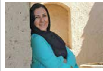
با خوانندگان مردم

فیلم سینمایی «صورت زخمی» بار دیگر و این بار توسط برادران فیلمساز کونن بازسازی خواهد شد. بر اساس اخباری که کمیاتی فیلمسازی یونیورسال اعلام کرده آنان و جوتل کونن برای بازسازی فیلم «صورت زخمی» اعلام آمادگی نموده و این فیلمنامه به زودی آغاز می‌شود. «صورت زخمی» محصول سال ۱۹۸۳ به کارگردانی «برایان دی‌پالما» یکی از معروف‌ترین فیلمهای تاریخ سینما و بازی‌های «آل پاچینو» است. این دومین بازسازی این فیلم کلاسیک تاریخ سینماست. فیلم «صورت زخمی» به کارگردانی «برایان دی‌پالما» نویسنده‌ی «لیور استون» خود بازسازی فیلمی به همین نام محصول سال ۱۹۳۲ به کارگردانی «هاوارد هاکس» است. این فیلم به داستان زندگی «تونی مونتانا» (آل پاچینو) یک پانزده‌ساله کوبایی و چگونگی تبدیل شدن او به مهم‌ترین گانگستر میامی می‌پردازد. به گزارش میزان، در ابتدا قرار بود «انتونی فاوکوا»، کارگردانی نسخه جدید «صورت زخمی» را بر عهده بگیرد، اما با کلاه‌گیری او از این پروژه سینمایی، کمیاتی یونیورسال اعلام کرد در مراحل نهایی انتخاب کارگردان است.