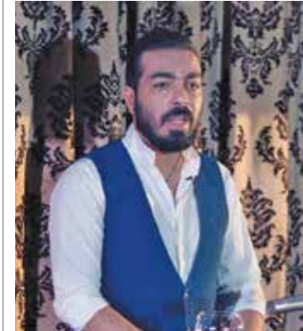
با خوانندگان مردم

فیلم سینمایی «صورت زخمی» بار دیگر و این بار توسط برادران فیلمساز کونن بازسازی خواهد شد. بر اساس اخباری که کمیاتی فیلمسازی یونیورسال اعلام کرده آنان و جوتل کونن برای بازسازی فیلم «صورت زخمی» اعلام آمادگی نموده و این فیلمنامه به زودی آغاز می‌شود. «صورت زخمی» محصول سال ۱۹۸۳ به کارگردانی «برایان دی‌پالما» یکی از معروف‌ترین فیلمهای تاریخ سینما و بازی‌های «آل پاچینو» است. این دومین بازسازی این فیلم کلاسیک تاریخ سینماست. فیلم «صورت زخمی» به کارگردانی «برایان دی‌پالما» نویسنده‌ی «لیور استون» خود بازسازی فیلمی به همین نام محصول سال ۱۹۳۲ به کارگردانی «هاوارد هاکس» است. این فیلم به داستان زندگی «تونی مونتانا» (آل پاچینو) یک پانزده‌ساله کوبایی و چگونگی تبدیل شدن او به مهم‌ترین گانگستر میامی می‌پردازد. به گزارش میزان، در ابتدا قرار بود «انتونی فاوکوا»، کارگردانی نسخه جدید «صورت زخمی» را بر عهده بگیرد، اما با کلاه‌گیری او از این پروژه سینمایی، کمیاتی یونیورسال اعلام کرد در مراحل نهایی انتخاب کارگردان است.