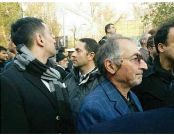
صادق زیباکلام بسیار اندوهگین بود. او جزو طرفداران پسر و باقرص تفکر آیت الله هاشمی برشمرده می شود.