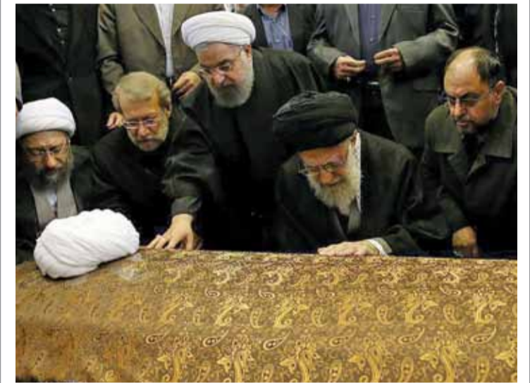
بی تردید این عکس با این تیتیر معنا می یابد: «لحظه وداع دو یار دیرین». دیروز حضرت آیت الله خامنه ای رهبر معظم انقلاب بر پیکر آیت الله هاشمی نماز میت خواندند.