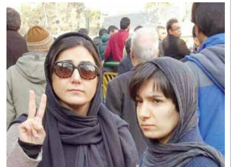
هنرمندان هم حضور پر رنگی در مراسم داشتند. باران کوثری بازیگر مشهور سینما و جمع دیگری از هنرمندان، پیکر آیت الله هاشمی را تا خانه ابدی همراهی کردند.