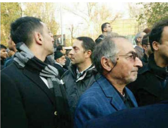
صادق زیباکلام بسیار اندوهگین بود. او جزو طرفداران پسر و باقرص تفکر آیت الله هاشمی برشمرده می شود.