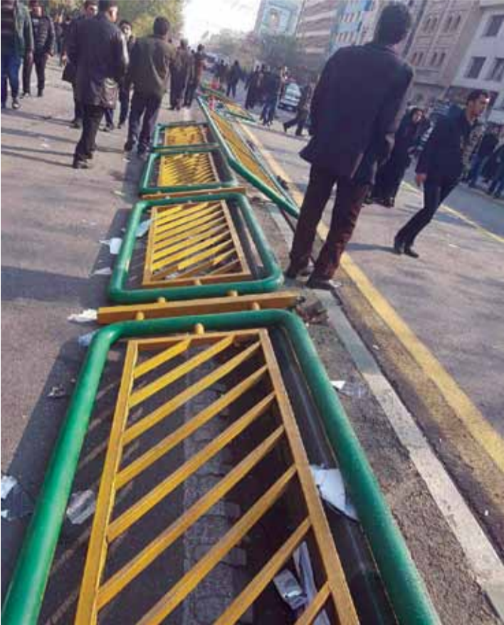
روز گذشته فشار جمعیت در خیابان انقلاب و پیرامون دانشگاه تهران به حدی بود که باعث شد نرده های این خیابان دچار آسیب جدی شود.

از طرفی آیت الله راه خویش را می رفت و هیچگاه نیز تحت تاثیر جوسازی ها و تبلیغات سوء گروه ها و حزب های مخالف در هیچ برهه ای از تاریخ زندگی خویش قرار نگرفت؛ چه در تاریخ مبارزات خویش علیه پهلوی و چه در بیان و اعمال تفکرات و سیاست های خویش در دوران پس از انقلاب. در واقع تحت تاثیر باد موافق نبودن منجر به شکل گیری شخصیتی منحصر به فرد و استوار از آیت الله گردید که نمی توان نقش بی بدیل وی را بر تاثیر گذاری بر معادلات و تصمیم سازی های حیاتی حکومت و مردم انکار نمود. موافق ثابت قدم بودن هیچگاه دلیلی بر این نگردید که آیت الله حتی با اطلاع از موج هجمه ها و تبلیغات منفی علیه خویش چشمش را بر حقایق ببندد و انتقادات را مطرح ننماید.