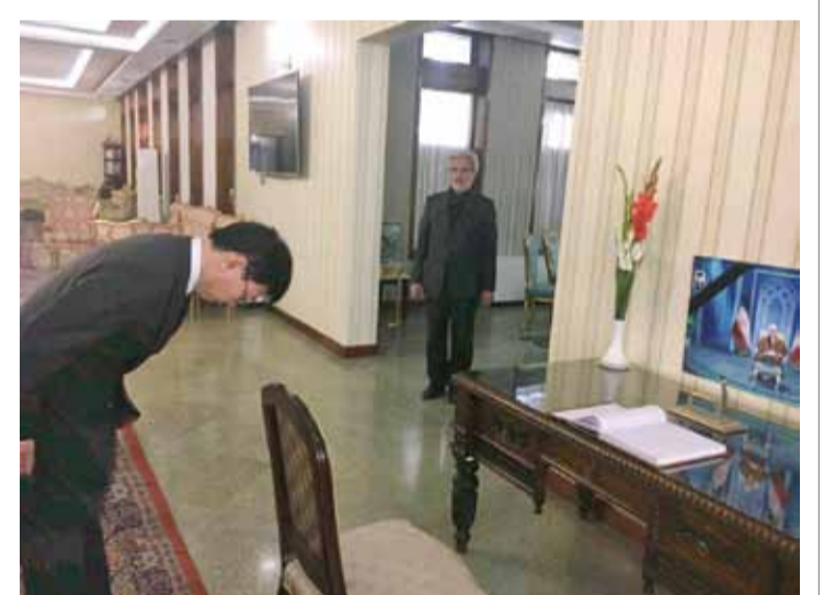
سفیر ژاپن در افغانستان هنگام امضای دفتر یادبود از تحال آیت الله هاشمی رفسنجانی در کابل اینگونه وقتی تصویر وی را می بیند ادای احترام می کند.