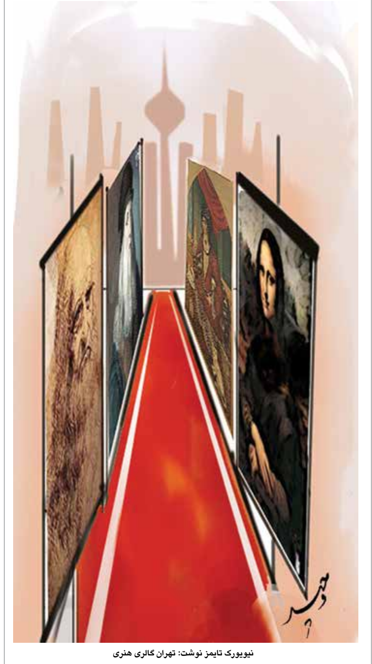
نیویورک تایمز نوشت: تهران گالری هنری