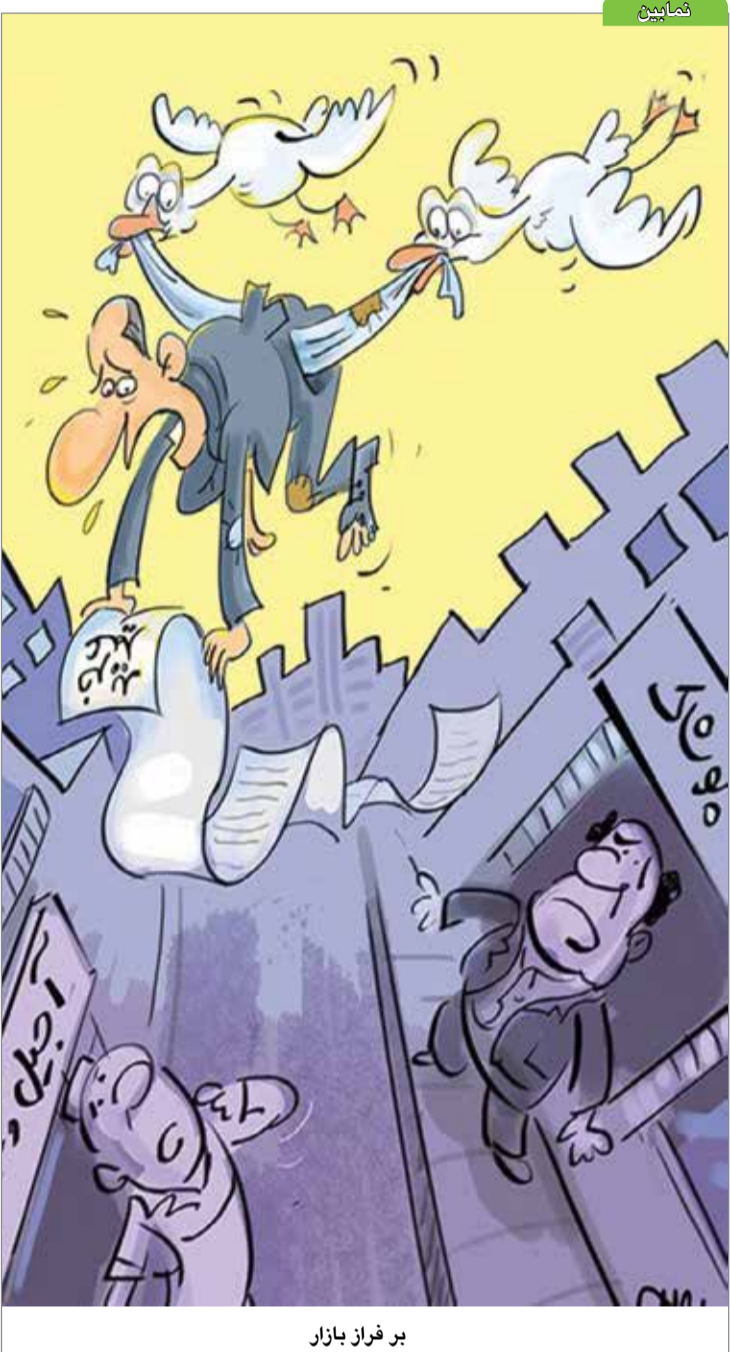
بر فراز بازار