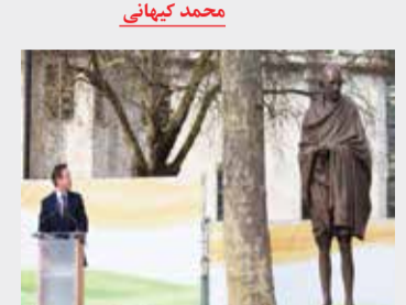
دادن مجسمه ماهاتما گاندی در این میدان مهم، حضور ابدی را برای او در کشور خود ایجاد می کنیم.»

روزگار عجیبی است؛ امروز مجسمه برنزی گاندی در قلب شهر لندن مقابل پارلمان زیر سایه برج بیکن اونهم در کنار مجسمه چرچیل دشمن قسم خورده اش که روزی قهرمان استقلال هند را فقیر نیمه برهنه خوانده و آرزو کرده بود تا گاندی در اعتراض غذایش بمیرد، جای گرفت. دیوید کامرون نخست وزیر انگلیس در مراسم نصب این مجسمه گفت: نصب این مجسمه تجلیل قدرتمندی از یکی از مهم ترین چهره های جهانی است. وی افزود: «ما با قرار