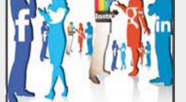
نه کسی تا به حال جوهری به قرض گرفته تا بر کاغذی روان داشته باشد. اینجا تنها افکار مشهوران را می گیرند و تکرار می کنند. تنها شهرت سروری دارد و عقلا بیت نوکری. جویات هیجانی محبوبیت می دهد و حقیقت گویی، دوری. تنها باید بنگری که خط افکار از کجا آمده و مدعیان چه واکنشی دارند. مطمئنا اولین واکنش ها بلافاصله تکرار می شوند. تکرار و تکرار و تکرار...

نوشتن دیگر معنایی ندارد. نه کسی میل به خواندن دارد و نه دیگر فضایی برای بیان نگرش های متفاوت وجود دارد. همه برای خود خبرچینی شده اند که خیره تکرار را از هم آموخته اند. تحریف گرانی بار آمده اند در جهت در افشانی های بی در پی! هر چه بنگاری و بگویی، اثری بر افکار خط گرفته افراد نخواهد داشت.