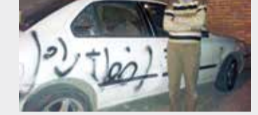
وزارت کشور هم متن جدیدی را در انتقاد از این رفتار برای خواندن در گوش خبرنگار چند رسانه همسو با خودشان آماده می کند. گروه فشار هم لابد کار خودش را می کند و مهیا پس از «اخطار آخر» می شود.

گویا «شیراز» خیلی در کنترل دولت مرکزی نیست. از آن محاصره کلاتری که خودروی علی مطهری (در روزی که او برای سخنرانی به این شهر رفته بود) از دست گروه فشار به آن جا پناه برد، این هم از جمله به خودرو مصطفی ترک همدانی و کیل علی مطهری که برای پیگیری شکایت مولکش از گروه فشار، به استان فارس سفر کرده است. گروه فشار پس از سوفاقد به جان مطهری این بار به او «اخطار آخر» را داده است. نماینده عالی دولت در استان فارس هم لابد در حال حاضر شدن برای بازگشت به تهران و دادن توضیح دوباره به وزیر کشور است. سخنگوی