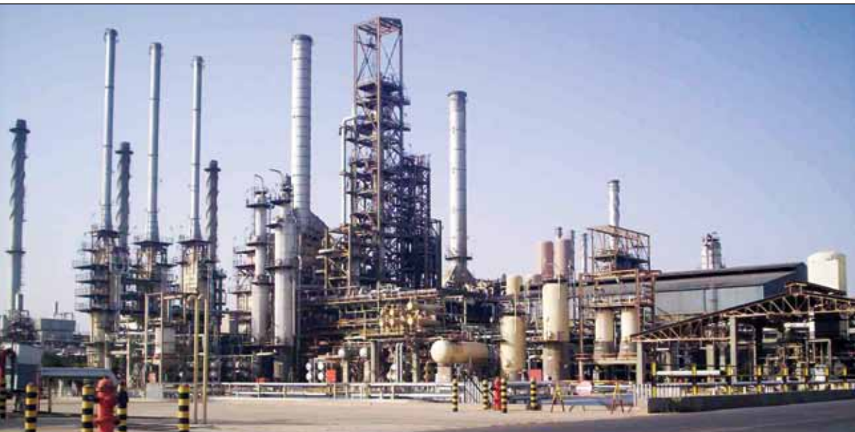
گزارش آفتاب یزد درباره توقف واگذاری ها در صنعت نفت

مهم نفتی اعلام شد مبنی بر اینکه شرکتهای نفتی از فهرست واگذاری خارج شدند. بیژن نامدار زنگنه از همان آغاز به کار دولت یازدهم، انتقادهایی را از روند خصوصی سازی شرکت های نفتی مطرح کرده و معتقد بود که این واگذاری‌ها نه تنها کمکی به رشد و توسعه صنعت نفت نکرده بلکه در مواردی موجب تضعیف این صنعت مهم کشور شده است. زنگنه در یکی از شدیدترین انتقادات خود از روند خصوصی‌سازی در دولت گذشته، مهر ماه امسال در جمع اعضای اتاق بازرگانی گفت: «متأسفانه در هشت سال گذشته، بخش خصوصی در کشور ضعیف شده و گوشت آن از بین رفته و فقط استخوان باقی مانده است که البته همین هم جای شکر دارد.» زنگنه در ادامه با انتقاد به خصوصی سازی‌های انجام شده در گذشته گفت: «متأسفانه واحدهای خصوصی شده از دست دولت خارج شده و در اختیار بخش دیگری از دولت قرار گرفته است.» وی افزود: «بنا نبود که وزارت رفاه، پالایشگاه و پتروشیمی داشته باشد، اما وزارت نفت این واحدها را در اختیار نداشته باشد.» وزیر نفت در ادامه خاطر نشان کرد: «این چه وضعی است که درست کرده ایم. من تکلیف خودم را نمی‌فهمم، بنا نبود که یک وزیر برای پالایشگاه